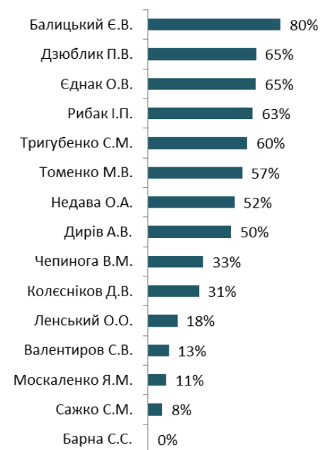
Частка екологічних законопроектів, від усіх поданих народним депутатом у 2015 р.

За даними офіційного веб-порталу ВРУ. Враховані лише проекти законів України.